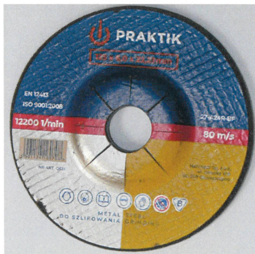
Ściernica płaska z obniżonym środkiem do szlifowania typ 27 / Depressed centre grinding wheel for grinding 27 type 125×6,0×22,23

Załącznik stanowi integralną część Certyfikatu Nr B-082/22. This Attachment forms an integral part of the Certificate No. B-082/22.